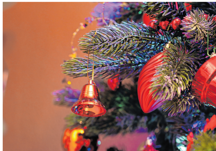
Het is bijna Kerstmis.