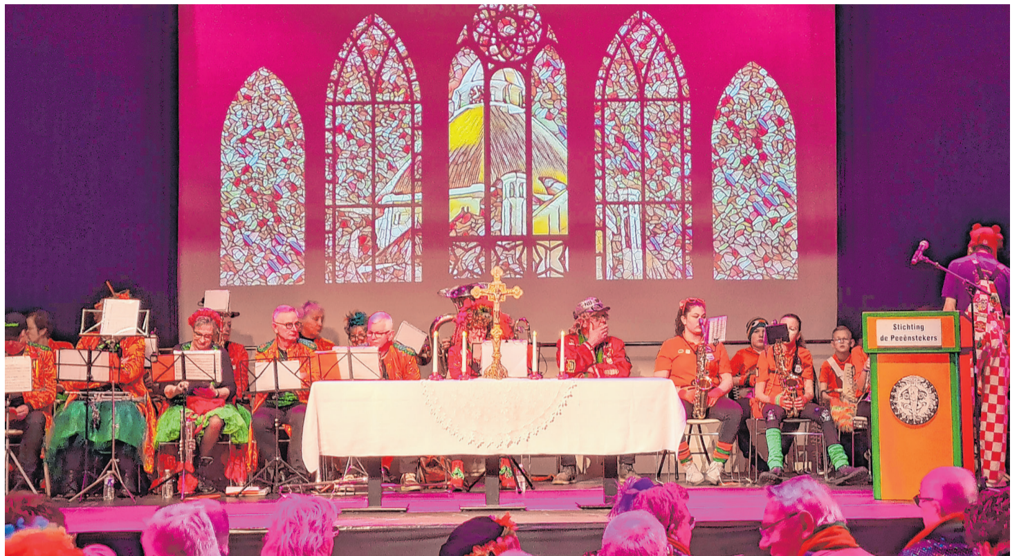
Carnavalsviering in De Cammeleur.