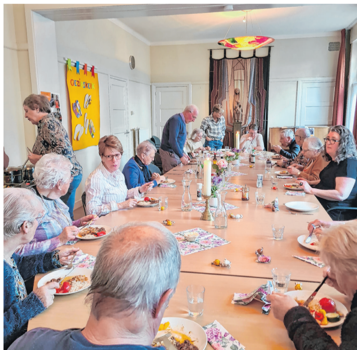
Vastenmaaltijd in Dongen.

De jaarlijkse vastenmaaltijd in het Parochiecentrum in Dongen voor maximaal 22 deelnemers is op maandagavond 23 maart om 17.30 uur. Aanmelden hiervoor is noodzakelijk en kan tot 8 maart